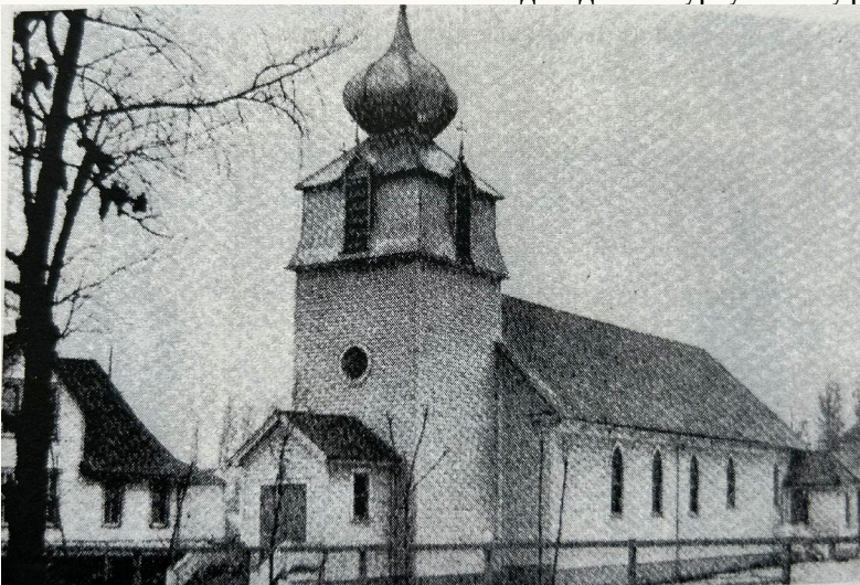
Перша церква св. Івана Хрестителя на 3564 Cicotte Ave. (1907)

"Подібно до інших парафій, при церкві св. Івана