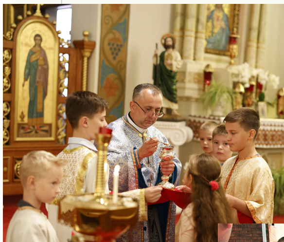
Вівтарна дружина на службі

й українські релігійні традиції. Кожного Різдва ходять колядувати до парафіян і гостей церкви, а на Великдень водять гаївки і розвозять паску старшим парафіянам, які не можуть фізично пересуватися.” Катехизацію молоді і дітей, і приготування до першої Сповіді та урочистого Причастя