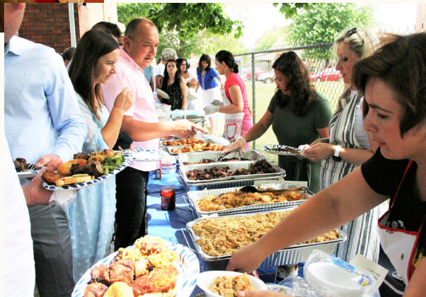
Святкування парафіяльного празника, червень 2023

Хрестителя існують парафіяльна і фінансова ради, сестринство, братство і молодіжна група. Сестриці займаються приготуванням їжі для різних парафіяльних подій у неділі і свята, декоруванням церкви, вишиттям одягу і фелонів. Завдяки братству навколишня територія коло церкви завжди є впорядкована, і також вони займаються ремонтами усіх парафіяльних приміщень, за що я їм щиро вдячний.” - розповідає о. Мирослав - “Дуже тішуся нашою молоддю, яка теж не стоїть осторонь і продовжує підтримувати церкву